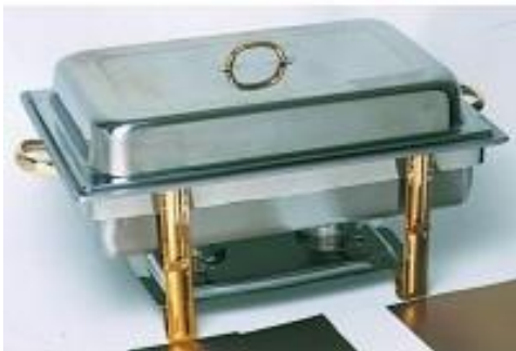
4 Buffetgeschirr lang